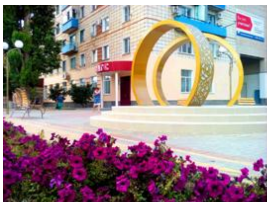
Фото с маршрута